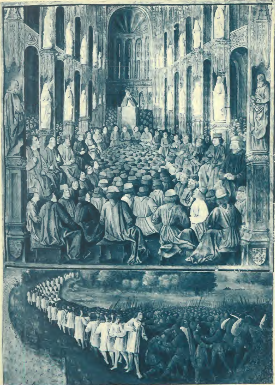
COMMENT LE PAPE URBAIN SECOND ASSEMBLA LE CONCILE DE CLERMONT ET COMMENT GAUTHIER SANS AVOIR MENANT GRANDE COMPAGNIE DE PÈLERINS PASSA EN HONGRIE